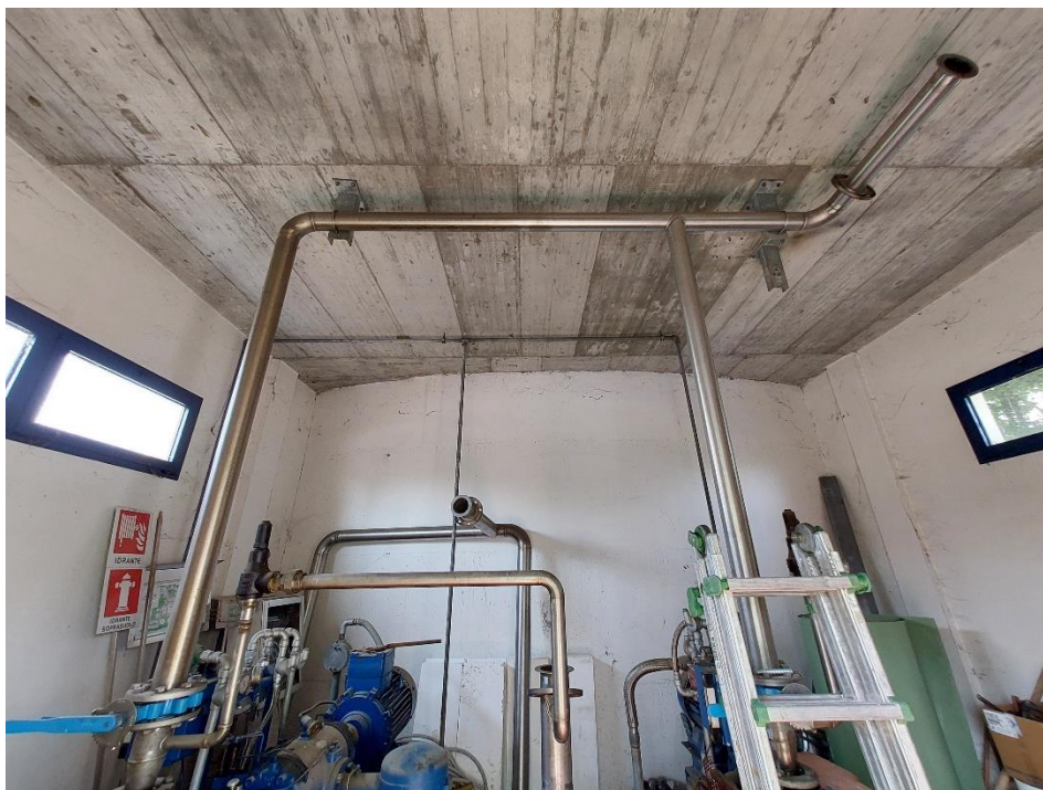
Foto 2: interno locale soffianti sul lato digestore punto cardinale in disuso